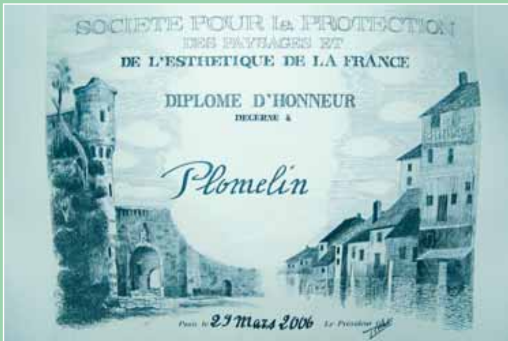
Le diplôme du Concours des municipalités

E-mail : mairie.plomelin@wanadoo.fr – Site Web : http://www.plomelin.com