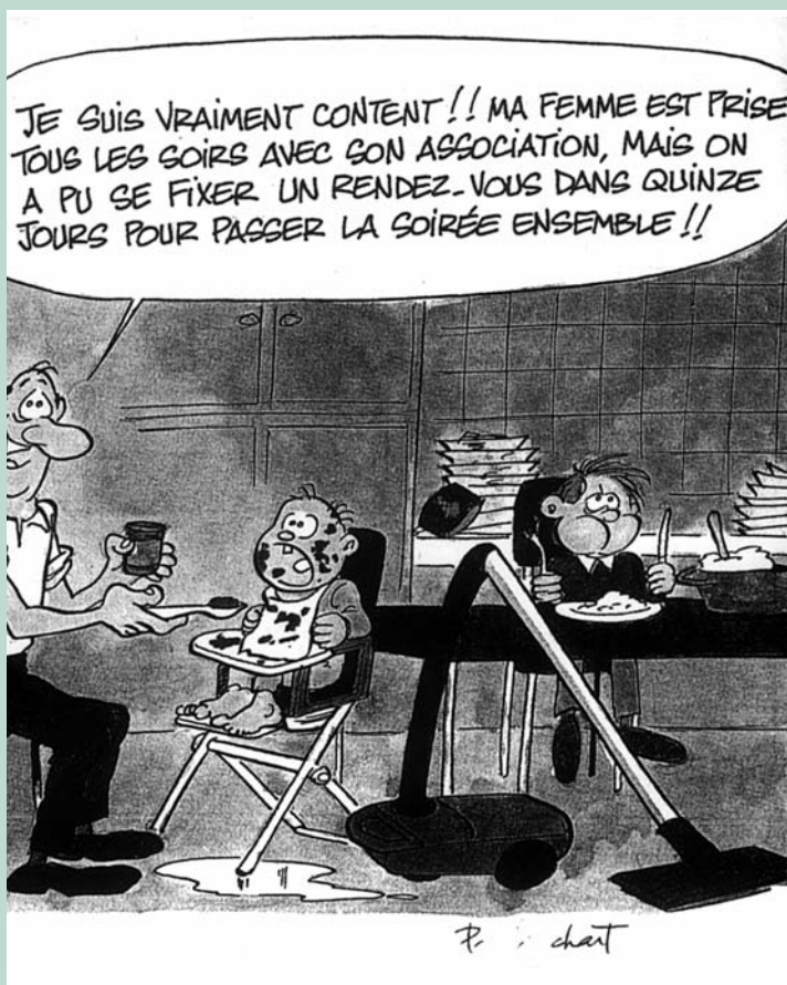
Dessin extrait de la revue "Associations – Mode d'emploi" Numéro 25, janvier 2001

D'abord en raison d'une certaine lassitude constatée chez les bénévoles qui ont pris des responsabilités : les jeunes aiment certes les associations mais ne s'engagent pas pour autant, semble-t-il, que la génération précédente. Or, sans le bénévolat, il n'y aurait pas de vie associative. Etre bénévole est devenu un métier qui demande de la compétence et du temps : un quart des adhérents consacrent au moins 20 heures par mois à leur association... Le cas du président est évidemment le plus parlant : on lui demande d'être à la fois informé, compétent, disponible, animateur, ouvert, impartial, de faire preuve d'autorité et d'assumer de plus en plus de responsabilités. Faudra-t-il un statut du bénévole ? Comment faciliter l'accès à la formation ?